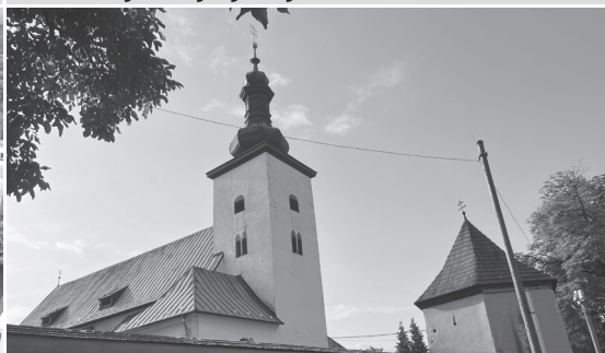
Kostol Nanebovzatia Panny Márie