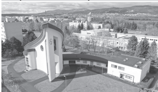
Farský Kostol sv. Terézie z Lisieux