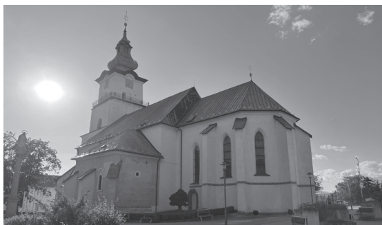
Farský Kostol sv. Bartolomeja

Jednotlivé časy sv. omši počas príkazných sviatkov je potrebné si z dôvodu prípadných zmien vždy overiť aj v aktuálnych oznamoch.