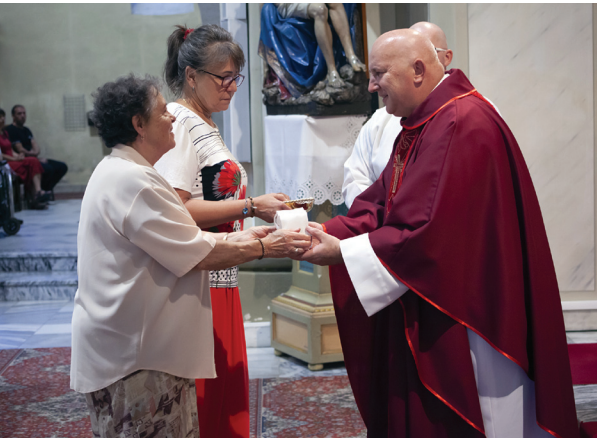
Oslava sviatku svätého Bartolomeja, 24. augusta 2024