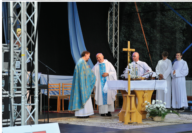
Púť k Nanebovzatej Panne Márii na Mariánskom vršku v Prievidzi, sobota 17. augusta 2024