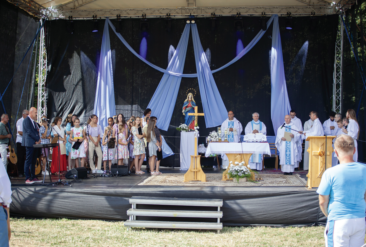
Pút' k Nanebovzatej Panne Márii na Mariánskom vršku v Prievdzi, nedeľa 18. augusta 2024