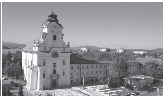
Kostol Najsvätejšej Trojice